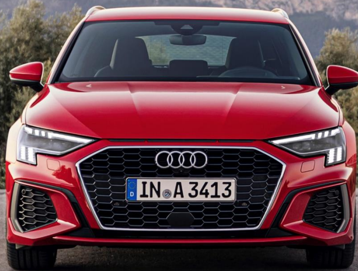
Abbildung zeigt Fahrzeug des Produktionsjahrs 2020 mit optionaler Sonderausstattung

* Audi A3 Sportback 30 TDI, 6-Gang-Handschaltgetriebe, 85 kW: Kraftstoffverbrauch (kombiniert): 4,8 – 4,4 l/100 km; CO 2 -Emissionen (kombiniert): 126 - 114 g/km; CO 2 -Klasse: D - C