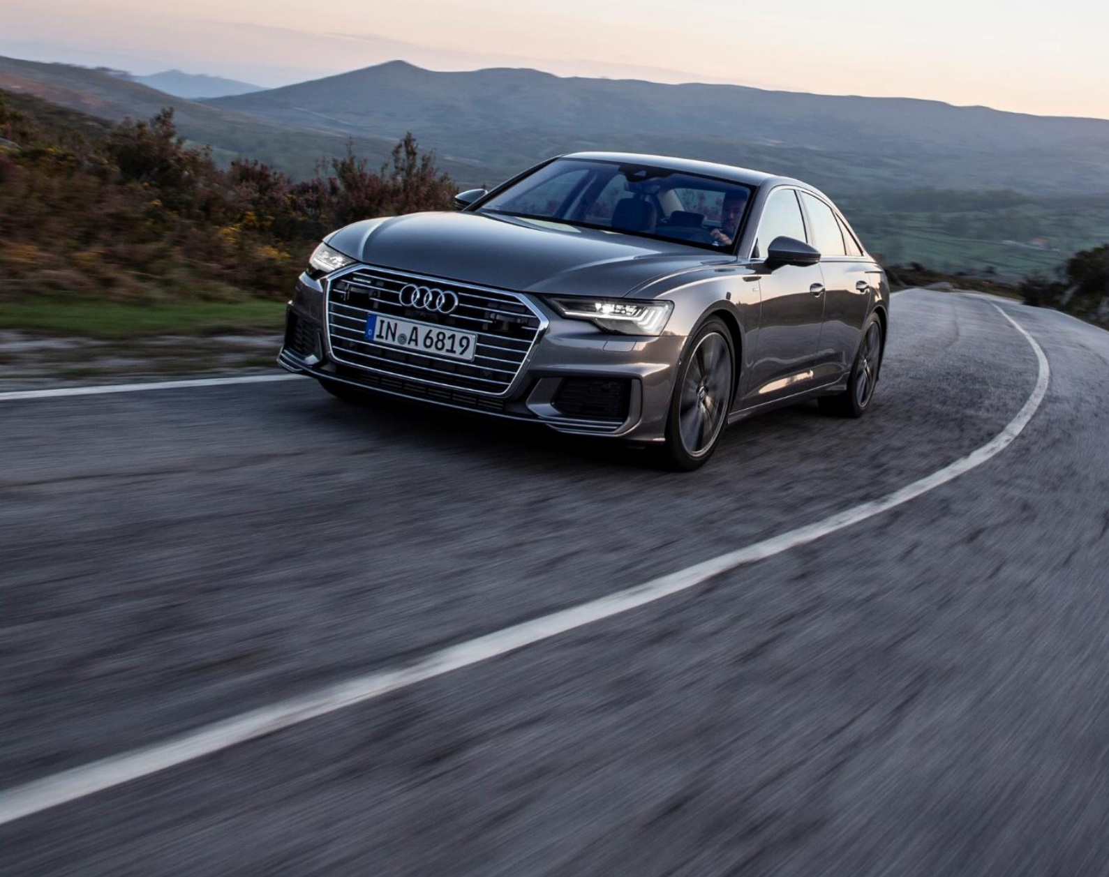
Abbildung zeigt Fahrzeug des Produktionsjahrs 2018 mit optionaler Sonderausstattung

* Audi A6 Limousine 50 TDI quattro tiptronic, 210 kW: Kraftstoffverbrauch (kombiniert): 6,9 – 6,3 l/100 km; CO 2 -Emissionen (kombiniert): 182 - 165 g/km; CO 2 -Klasse: G - F